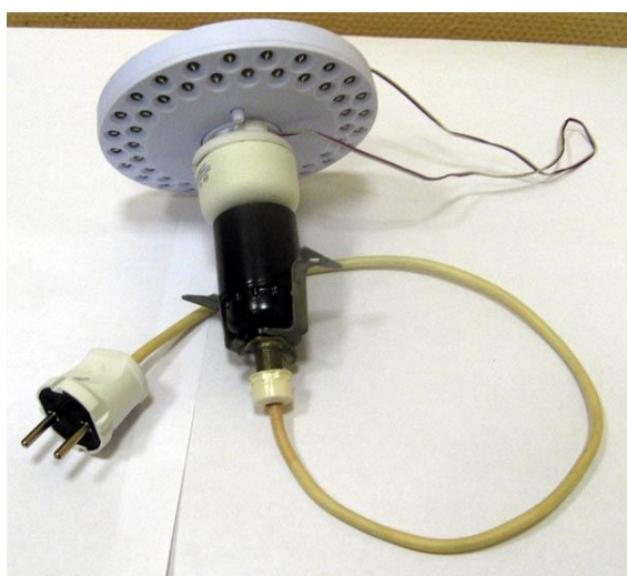
Рисунок 5. Готовый светильник.

В принципе, любой сломанный фонарь можно использовать для изготовления такой лампы. Главное, не превышать рабочий ток светодиодов и предусмотреть все возможные меры электрической и пожарной безопасности. В режиме холостого хода на выходе балласта напряжение может превышать 200 В,