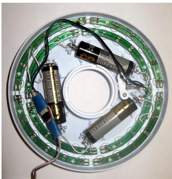
Рисунок 4. Фонарь ЭРА со снятой крышкой.

На Рисунке 5 показана получившаяся конструкция.