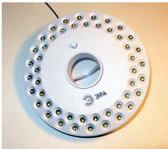
Рисунок 1. Туристический фонарь ЭРА.

В качестве нагрузки балласта можно использовать очень дешевый китайский туристический фонарь (Рисунок 1), предназначенный для освещения палаток. Он имеет круглую форму с отверстием по центру и систему крепежа для подвеса его в палатке. Питается он от трех батареек типа АА, содержит 48 сверхярких светодиодов, имеет кнопку