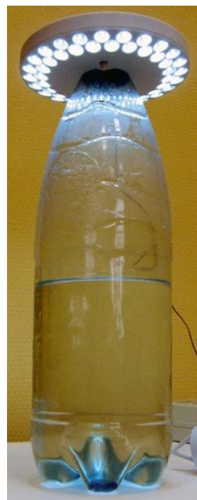
Рисунок 6. Настольная лампа.

поэтому между светодиодами и балластом не должно быть низковольтной электроники, которая есть, например, у мигающих фонариков. Также следует иметь в виду, что электронный балласт не обеспечивает гальванической развязки от сети переменного тока 220 В, так что монтаж надо делать качественно.